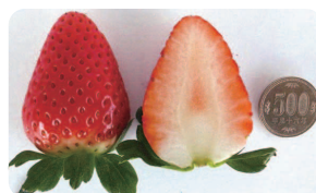
栃木県の新品種「スカイベリー」 時期によっては卵(50g)以上のものも！

とちぎ農産物クチコミ隊の皆さん、こんにちは。4月から隊長になりました鈴木です。よろしくお願ひします。皆さんには、栃木県の農産物をご愛顧いただき、クチコミで本県産農産物を宣伝して頂き、誠にありがとうございます。 前の職場が農業試験場だったので、栃木県が最近開発した新品種を少しご紹介させていただきます。 ■まずはじめは、いちごの新品種「スカイベリー」です。いちご研究所で17年間、約10万株の中から選ばれたエリート中のエリート。ジュシーで上品な味わい、大粒できれいな円すい形の最高級のいちごが出来ました。今年は試験的(58人・2・5畝栽培)な栽培ですが、多くの皆様から高い評価を頂いております。とても大き